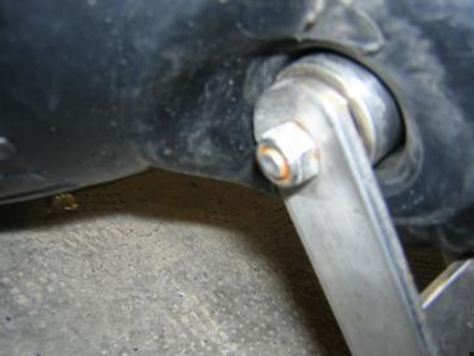
Fixation au pare-batage