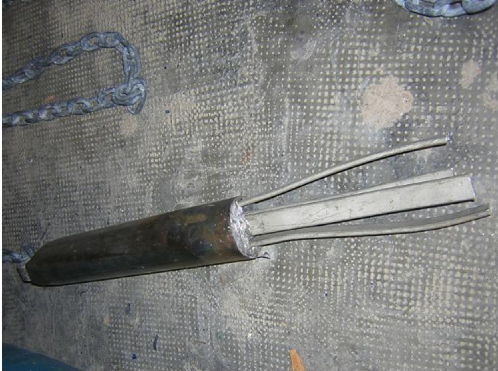
Réalisation du grappin lesté