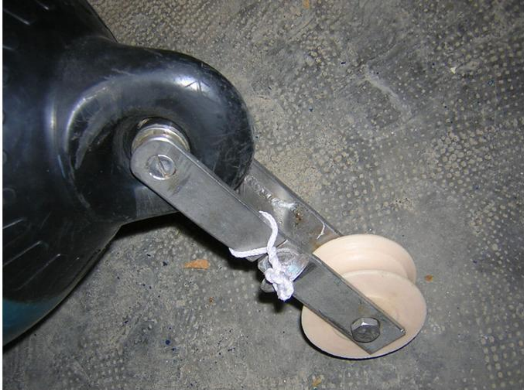
Réalisation de la poulie de bouée gibie ,au tour ,dans du PVC de diamètre 100