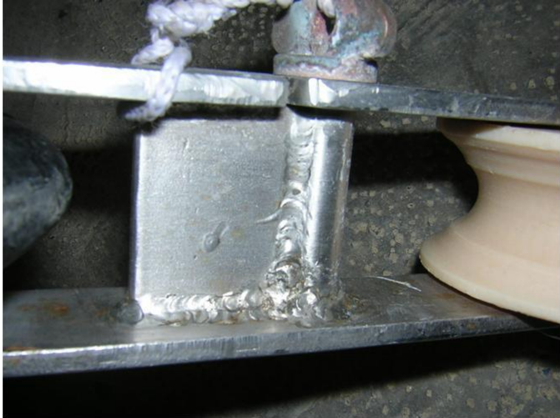
Vue de détail de la réalisation