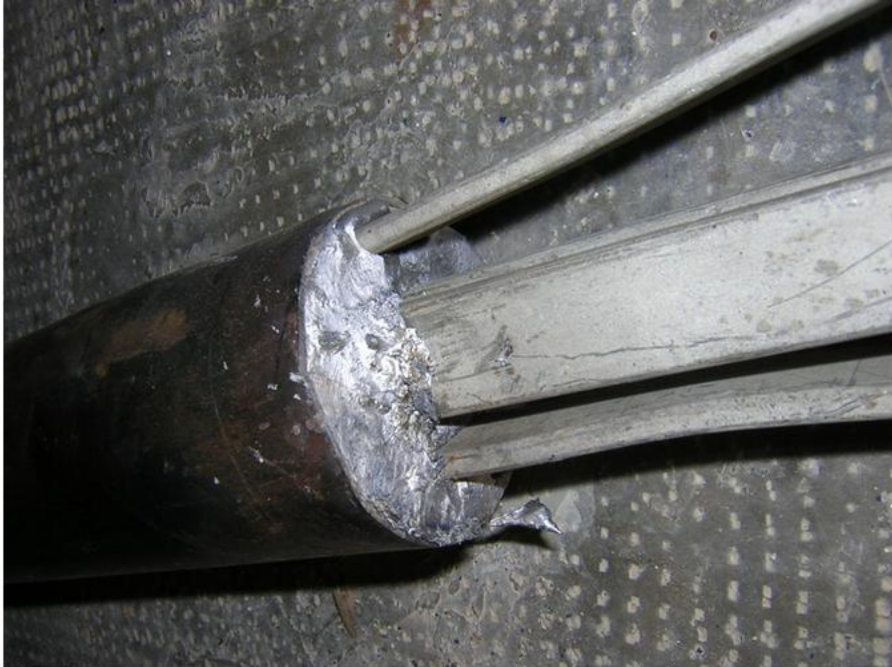
Vue sur le plomb coulé à l'intérieur du tube