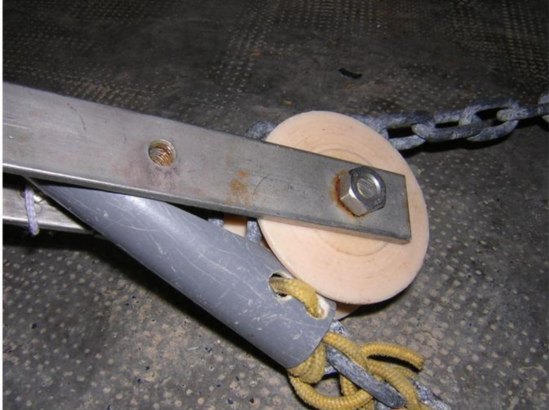
Réalisation du ardillon de grappin