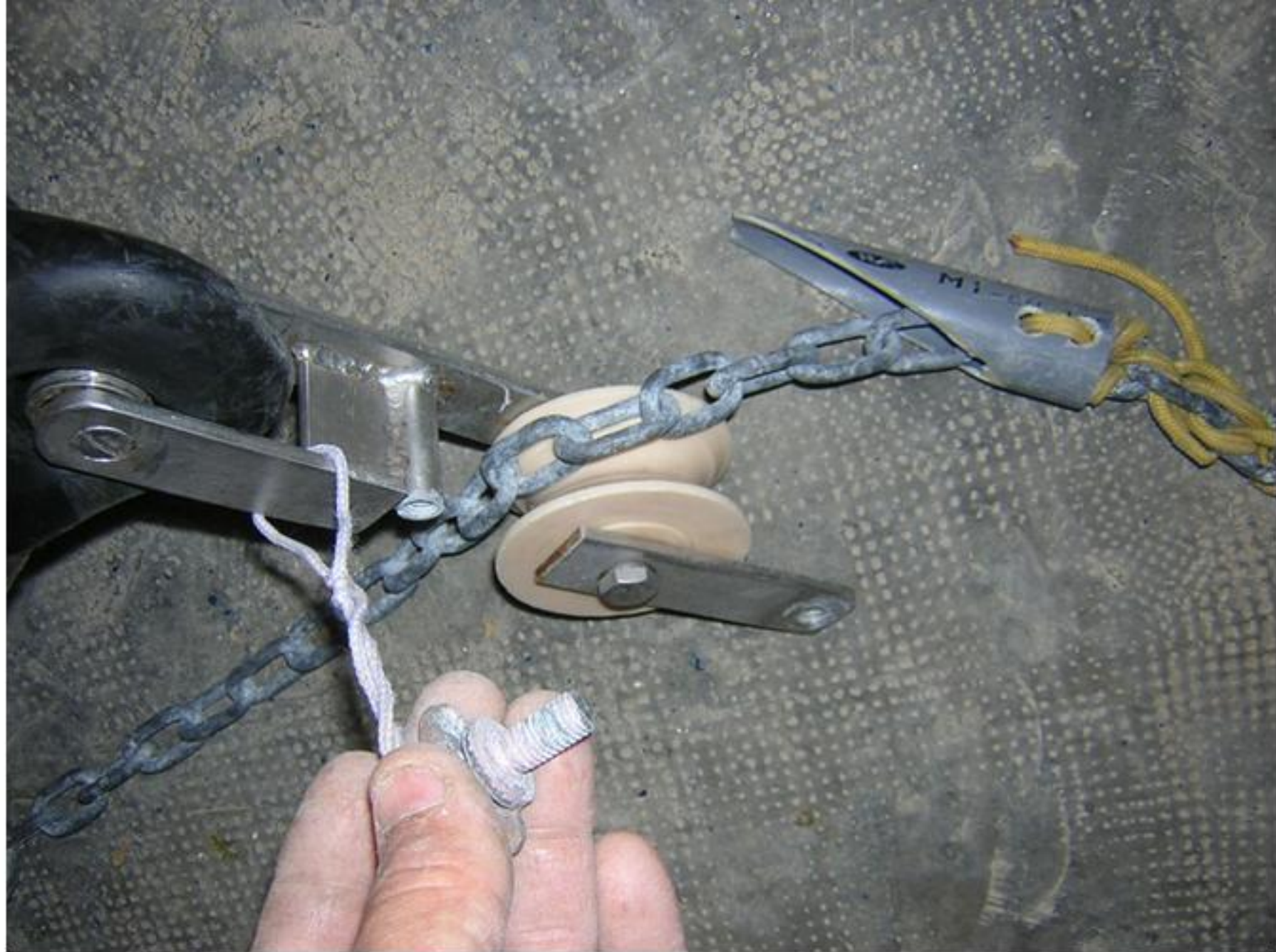
Passage de la ligne de mouillage