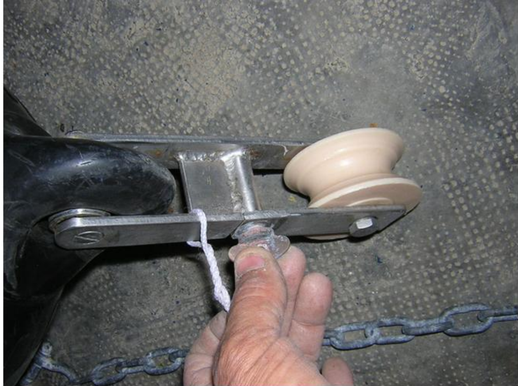
Dévisserie du papillon de la partie mobile